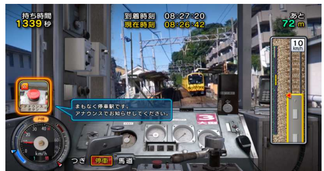
【ワンマン！なりきり運転】アナウンス・ドアの開閉操作に挑戦