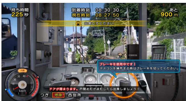
【区間走行】ガイド機能でサポート

従来のマスコンとブレーキを使用した運転方法はそのままに、駅から発車する際に 車内アナウンスの放送とドアの開閉が操作可能 になりました！本物の運転士になったつもりで安全運転を心がけましょう！