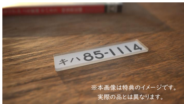
※本画像は特典のイメージです。 実際の品とは異なります。