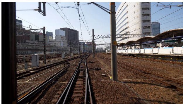
オリジナルムービーでは、運転とは異なる情景が楽しめます。

さらに、発売を記念した「キハ85系・ミニチュア形式プレート」もパッケージ内にもれなく同梱され、特別收藏版の装いで鉄道ファンの皆さまにお届けいたします!