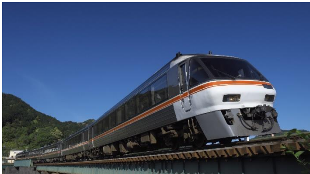
大きな前面窓が特徴の「非貫通型」先頭車

ダイヤと停止位置を守って懐かしの特急運転に挑戦してください!ゲームでは非貫通型先頭車の運転台で楽しみ頂けます。