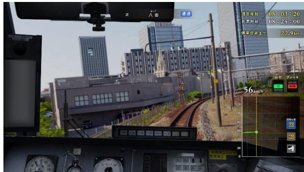
広い視界から迫力の眺望で運転が体験できます。