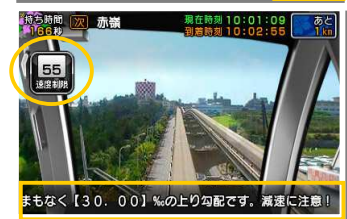
運転ガイドや停車位置ガイド 速度計をチェックしよう！