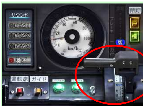
ワンハンドルマスコン 力行操作とブレーキ操作を1つのハンドルで行います

「ゆいレール編」で初登場のワンハンドル式のマスコン操作は、これまでのシリーズの運転感覚とは随分と異なります。これまでの操作とは違う、新たな運転体験をお楽しみ下さい！モノレール路線の特徴である急カーブや急勾配では意図しない加減速にも要注意！特に首里城駅の周辺には60‰（パーミル）という国内の鉄道としても屈指の急坂があります！車両はパワフルな走行性能を持っており、どんどんスピードが上げられますが、頻繁に生じる速度制限には注意が必要です。速度計の外周に点灯する制限速度信号や、停車位置の遠近を示す停車位置ガイドなどの機能を駆使して、高評価を狙いましょう！