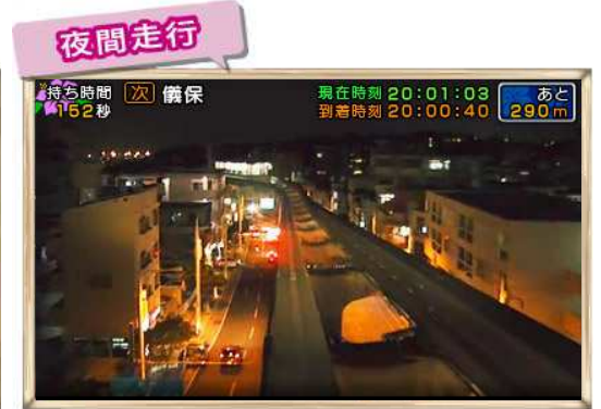
※ 画像は開発中のものです。