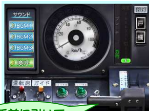
手前に引いて 力行(のきこ)